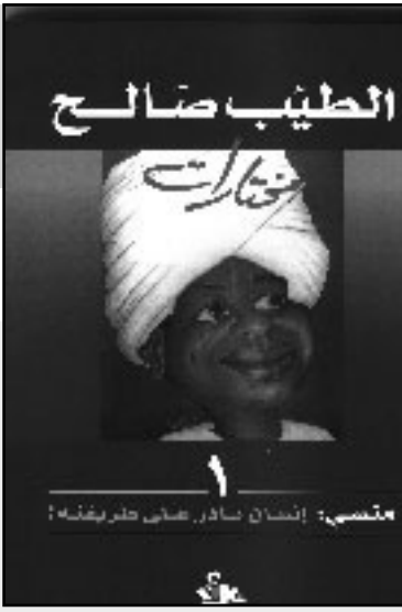
مختص: إنسان نادر على طريقته

ضو البيت ومريود وفيهما يعدد صالح إلى استلهام التاريخي والأسطوري ويتوغل في تراث الأمة الأصيل ووعيتها الجمعي وهنا تجيء النقلة النوعية ففي موسم الهجرة إلى الشمال اتجاه الرحلة الآخر إلى شرق/ غرب/شمال/ جنوب وهنا عودة إلى الذات، توغل في المنبع بتندر شاه الوافد الغريب أبيض اللوم بتمنازج ويتزوج من سمرء ويدخل في صميم المجتمع المحلي. بندر شاه وابنه يحدثان الكثير من التغييرات في بنية مجتمعه الرواية. وهكذا تقف إزاء لغز الحياة العصبي، أين وكيف الخلاص؟ يجيب الناقد الراحل عبد الوهاب حسن خليفة (خلاص الإنسان السوداني في اقترابه من جذوره الصوفية وأن ابتعاده عن تلك الجذور سوف يجر عليه المتاعب والفوضى) كما فهم الناقد من روايات صالح.